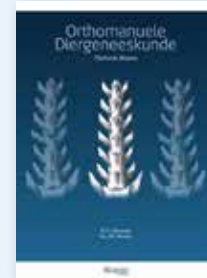
Orthomanele Diergeneeskunde, 2018, 264 pagina's,