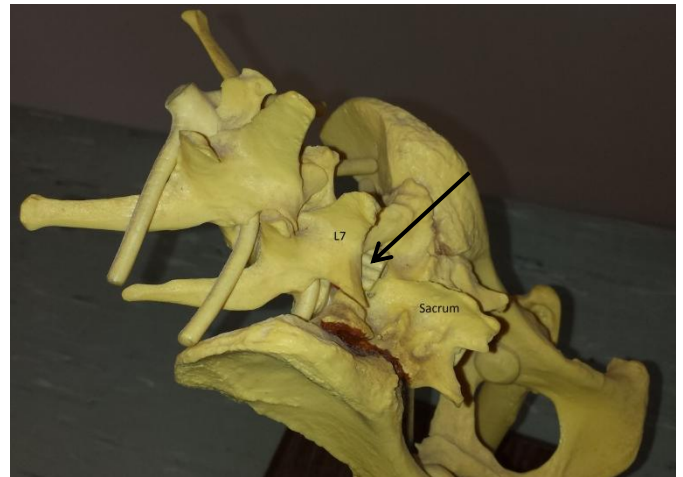
Foto 1: skeletafbeelding van de overgang van de laatste lendenwervel (L7) naar het sacrum (heiligbeen) met daartussen het ruggenmerg (pijl).

In het normale skelet van een hond loopt het ruggenmerg door de wervels heen van kop tot staart. Echter, bij de overgang van de laatste lendenwervel (L7 genaamd) naar het heiligbeen (ook wel sacrum of S1 genoemd) komt het ruggenmerg meer aan de oppervlakte. Bij iedere beweging waarbij L7 iets draait ten opzichte van S1 ontstaat er iets druk op het heiligbeen. Dit is bijvoorbeeld het geval bij ergens op- of afstappen of springen. Normaal is springen of ergens op- of afstappen niet pijnlijk, maar als er sprake is van lage rugpijn doet het door de extra druk op het ruggenmerg wel pijn en zal een hond minder genegen zijn om te springen of heeft een hond moeite met opstaan omdat hij probeert de pijn te vermijden.